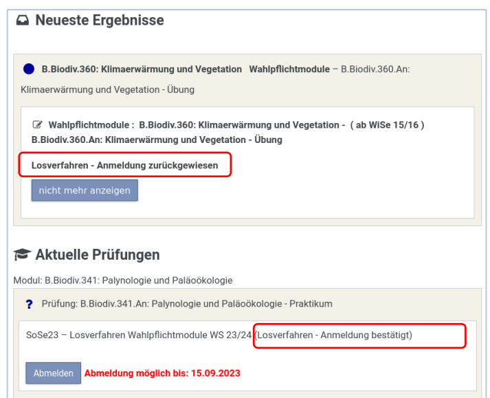
Abb 2: Nach der Verlosung - Anmeldung zurückgewiesen bzw. bestätigt

Anschließend sehen Sie auf Ihrer Flexnow-Startseite, welche zwei Wahlpflichtmodule Sie erhalten haben („Anmeldung bestätigt“) und welche zwei Sie nicht erhalten haben („Anmeldung zurückgewiesen“), siehe Abb. 2.